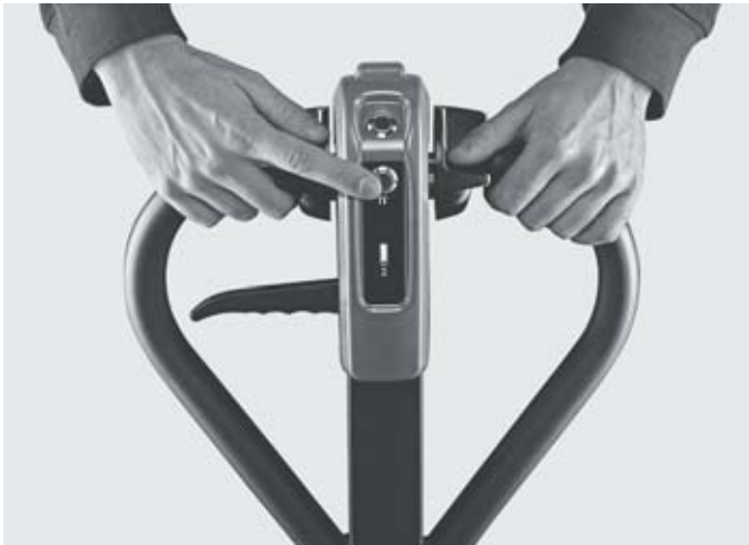
Эргономичная и интуитивно понятная рукоятка управления для неустойчивой работы