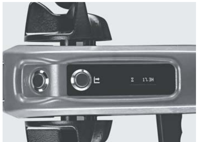
Всегда в поле зрения: на multifunctionальном дисплее отображается информация о количестве моточасов, уровне заряда АКБ и сервисном обслуживании