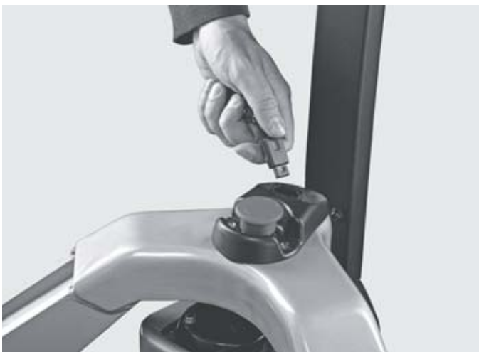
Высокий уровень безопасности благодаря уникальному безключевому доступу, предотвращающему несанкционированное использование третьими лицами