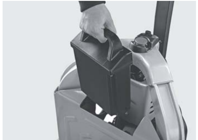
Высокая эксплуатационная готовность благодаря использованию литий-ионной батареи Li-Ion с возможностью быстрой подзарядки.