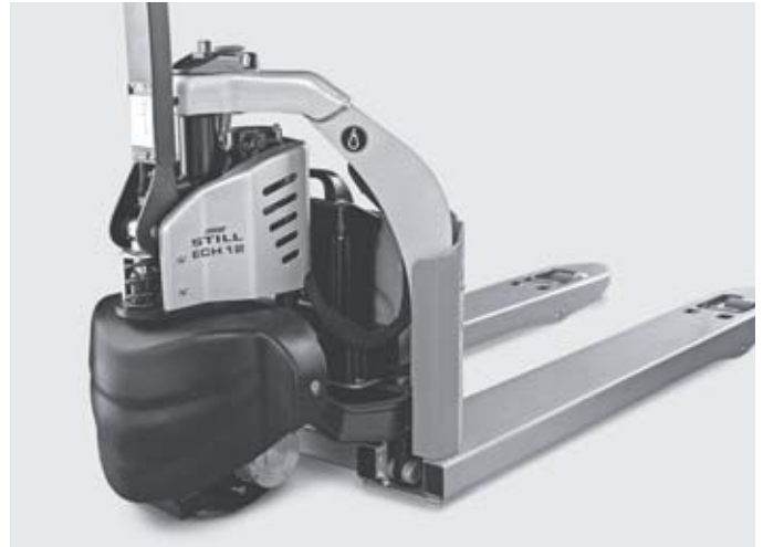
Прочная конструкция рамы и низкорасположенное шасси для максимальной безопасности оператора