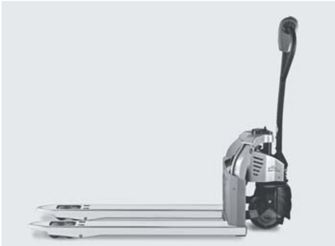
Работа в условиях ограниченного пространства благодаря компактности ручной гидравлической тележки